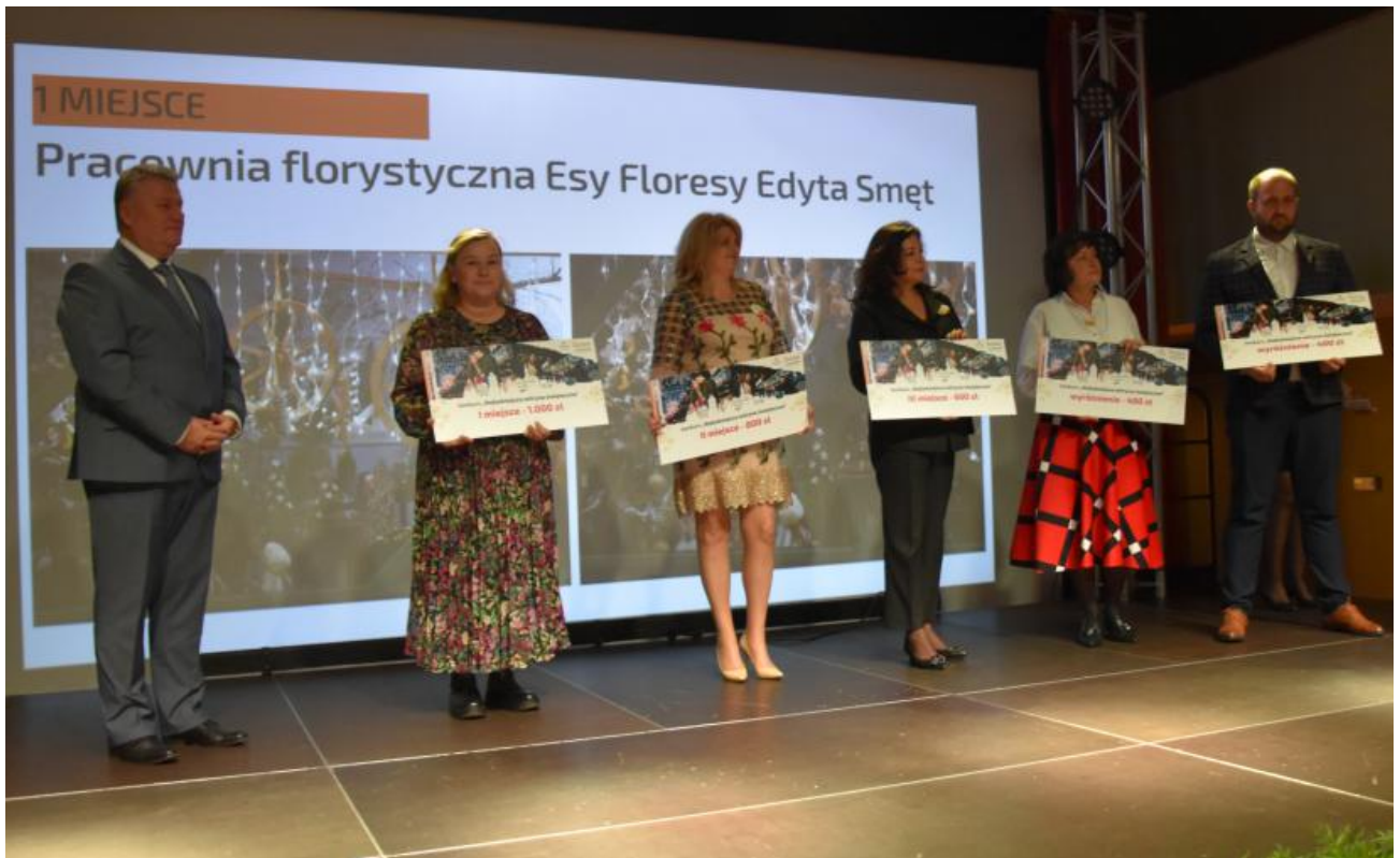
Laureaci konkursu na Najładniejszą Witrynę Świąteczną